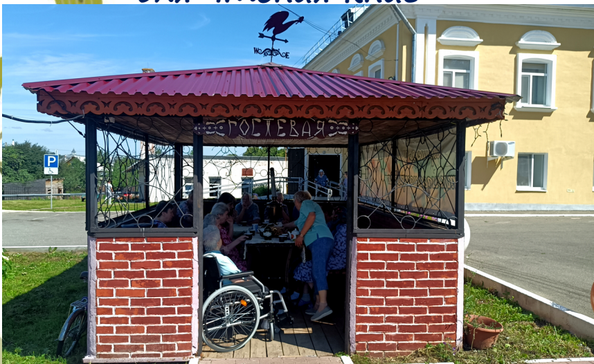
Гостевая беседка для встречи с гостями