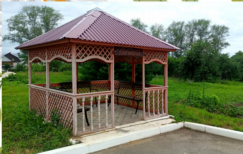
Дворянская беседка для чтения книг

На территории есть беседки для комфортного отдыха на свежем воздухе