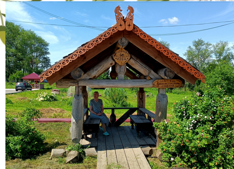
Лубяная избушка для разговоров по душам

Праздничная беседка, где проходят массовые уличные гуляния и праздники: праздник огурца, праздник урожаея, арбузник.