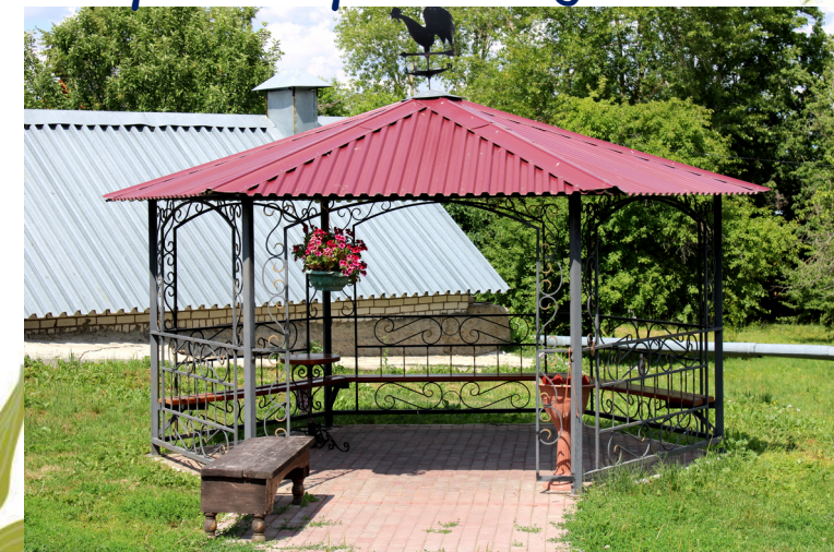
Княгининская беседка для настольных игр